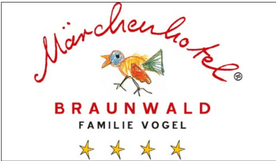
Logo des Märchenhotels in Braunwald

Ausgangslage: In der Hotellerie wird Nachhaltigkeit immer öfter Bestandteil der Unternehmensführung. Ein Hotelbetrieb ist den verschiedensten Anforderungen einer nachhaltigen Betriebsführung ausgesetzt. Dazu zählen eine effiziente und nachhaltige Energieversorgung, optimales Ressourcenmanagement sowie eine sozial nachhaltige Personalführung. Diese Arbeit soll den Einstieg in das Thema Nachhaltigkeit in der Hotellerie-Branche liefern. Der Fokus lag dabei auf dem Bereich Ressourceneffizienz. Dafür wurden relevante Grundlagen recherchiert und allgemeine Handlungsfelder in einem Hotelbetrieb identifiziert. Für diese Handlungsfelder wurde ein allgemeiner Massnahmenkatalog erarbeitet. In einem zweiten Teil der Arbeit sollen spezifische Massnahmen für ein konkretes Objekt, das Märchenhotel in Braunwald, ausgearbeitet werden.