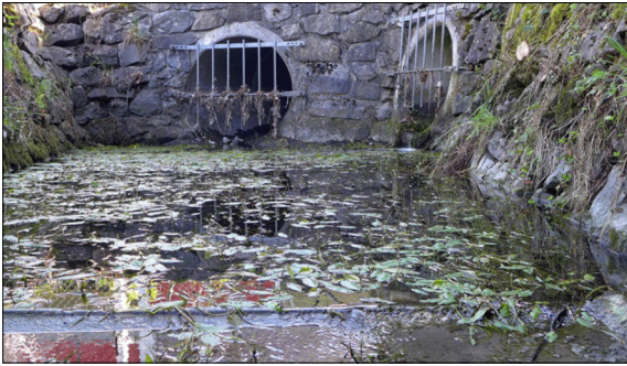
Regenwasserauslass: Mögliche Messstelle