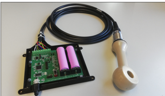
Induktives Leitfähigkeitsmessgerät Version 1.0

Um erste Erfahrungen im Umgang mit der Leitfähigkeitsmessung zu sammeln, soll zu Beginn ein käufliches Messgerät in Betrieb genommen und anschliessend analysiert werden. Wie wird der Sensor genau angeregt? Was für Empfangsamplituden und Phasenverschiebungen werden gemessen? Wie wird daraus die Leitfähigkeit berechnet? Darauf basierend sollen Methoden zur Signalanregung, Messung des Empfangssignals und der Signalverarbeitung mit niedrigem Energieverbrauch evaluiert und realisiert werden. Schlussendlich soll ein Prototyp entstehen, der unter realen Bedingungen an einer geeigneten Testanlage der Eawag in Dübendorf getestet werden soll.