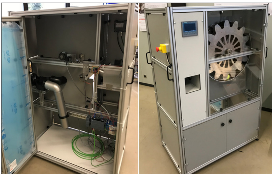
Ausgabelager Endversion Eigene Darstellung

Ergebnis: Es wurde ein Ausgabelager gefertigt, welches in einer Art Revolversystem 15 fertige Bälle aufnehmen kann. Um einen Ball aufzunehmen oder auszugeben, dreht sich der Revolver, angetrieben von einem Schrittmotor, in die entsprechende Position. Die Steuerung ist in einer Siemens SPS umgesetzt, welche auch die Bahnplanung der beiden Schrittmotoren vornimmt. Vorgesehen ist, dass über einen QR-Code Scanner der Code auf dem Smartphone des Kunden eingelesen werden kann und so der kundenspezifische Ball ausgegeben wird. Der Aufbau des Ausgabelagers ist soweit abgeschlossen. Programmiert und getestet ist der Ablauf für das Einlagern eines Balls.