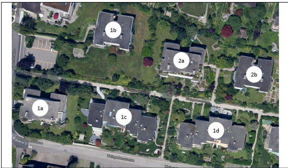
Abb. 1: Luftaufnahme der Siedlung Lattenberg in Männedorf.