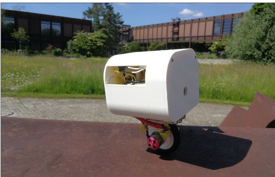
Fertiger Einrad-Roboter Eigene Darstellung

Fazit: Der mechanische Aufbau des Roboters funktionierte. Die Motoren und Sensoren konnten erfolgreich in Betrieb genommen werden. Bei der Simulation der Regler im Modell konnte die gewünschte Stabilität erreicht werden. Beim Demonstrator sind mehrere Herausforderungen aufgetreten, vorwiegend beim Verarbeiten der Sensordaten und beim Bestimmen des Schwerpunktes. Zudem stellte das unabhängige Kalibrieren einer einzelnen Fallrichtung ein Problem dar.