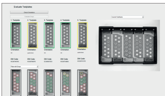
Entwickeltes GUI um Testplatten zu evaluieren