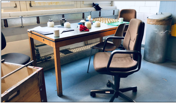
Abbildung 1: Momentaner Arbeitsplatz für die Primerauftragung

Ausgangslage: Ein Tätigkeitsgebiet der Firma Kundert AG ist es, Bauteile aus Kunststoff oder Metall mit Polyurethan zu beschichten. Dabei muss bevor das Polyurethan auf die Teile gegossen wird, eine Haftschrift mit Primer aufgetragen werden. Bis heute wird die Primerschicht manuell von Hand mittels Pinsel oder bei grösseren Werkstücken mit einer Sprühpistole aufgetragen. Nun möchte die Kundert AG beim Prozessschritt Primerauftrag mittels Automatisierung die Qualität und Effizienz verbessern.