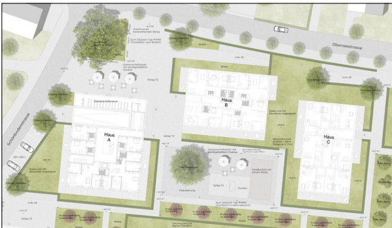
Die beiden siedlungsinternen Plätze vereinen unterschiedliche Freizeitmöglichkeiten. Eigene Darstellung