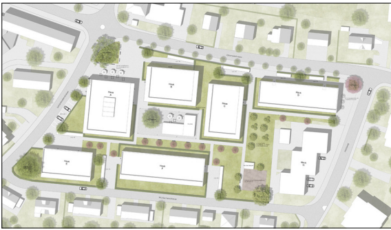
Die neugestaltete Überbauung zeichnet sich durch die zentrale Lage und deren guten Erschliessung aus. Eigene Darstellung