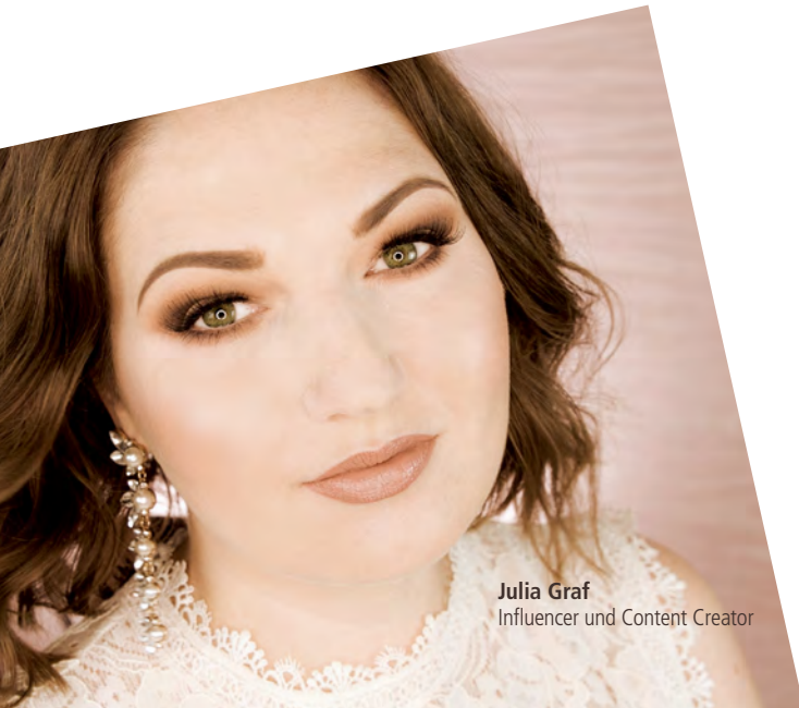
Julia Graf Influencer und Content Creator