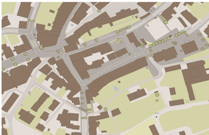
Betriebs- und Gestaltungskonzept über das Zentrum Wil

Fazit: Mit dem Konzept kann die Altstadt in einen attraktiven Begegnungsort umgewandelt werden. Es können neue Aufenthaltsbereiche mit identitätsstiftenden Elementen geschaffen werden. Die Grundlage dafür bildet die Verlagerung der Verkehrsströme auf die neue Grünaustrasse und die Verhinderung von Durchgangsverkehr im Zentrum durch die Netzunterbrüche im Strassennetz.