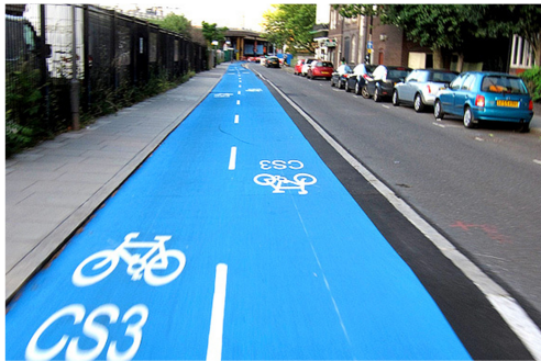
Beispiel: Cycle Super Highway in London

Erarbeitung von überörtlichen, schnellen Radverbindungen für den Alltagsverkehr im Rahmen eines Teilplans des kantonalen Velonetzplans