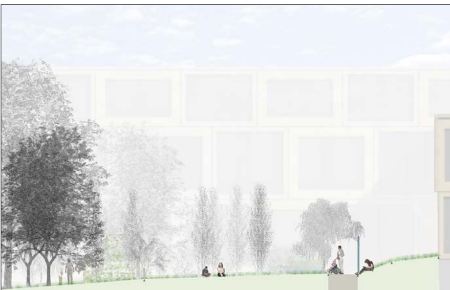
Schnitt durch Gartenbereich

Ergebnis: Durch unterschiedlich lange Rundwege und die immer wiederkehrende Form des Oktagons werden die Patienten und ihre Bezugspersonen durch den Aussenraum geführt. Diverse krank- und behindertengerechte Spielgeräte laden die Kinder ein, den Garten zu entdecken und darin zu spielen. Geleitet von Felix, einer Comicfigur, entdecken die Patienten Überraschungen im gesamten Aussenbereich. Durch die Bepflanzung der Hochbeete werden die Sinne gefördert und die Beobachtung von Wildtieren ermöglicht sowie Rückzugsräume geschaffen. Leitpflanzen mit speziellen Eigenschaften gestalten einen Aussenraum, der das ganze Jahr in einer attraktiven Gestalt daherkommt.