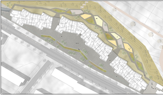
Vorprojekt der Umgebungsgestaltung Architektur: Bachelard Wagner

Ausgangslage: Die Parzelle der Burgfelderstrasse liegt in Basel, nahe an der Grenze zu Frankreich. Basel liegt zu beiden Seiten des Rheins und ist somit das einzige Gebiet der Schweiz rechts des Hochrheins. Der Perimeter gehört zur Grünanlagezone und die Hangkante partiell zur Landschaftsschutzzone, somit sollte der Bereich der Hangkante der ökologischen Aufwertung und Vernetzung dienen. In diesem Bereich soll eine genossenschaftliche Wohnungsüberbauung mit Freiraum entstehen. Durch die Kombination mit dem vorhandenen Zollhaus werden Synergien zwischen privatem Bauprojekt und angrenzender öffentlicher Freiräume geschaffen.