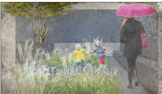
Visualisierung der vertiefte Sitzstufen bei Regen

Auf der vorderen, sonnigen Seite des Gebäudes, befinden sich vertiefte Sitzstufen, in Form des Stadtrheins, mit einer Bepflanzung, die an den Flusslauf in Basel erinnert. Die Pflanzung besteht aus Gräsergruppen und symbolisiert die Bewegung des Wassers; blau blühende Stauden setzen Akzente. Dieses Retentionsbecken schirmt den Asphaltplatz von der Strasse ab und dient der Entwässerung. Nebst einer Fläche zum Spielen, Warten und Feste feiern, dient der Platz auch als grosszügiger Eingangsbereich.