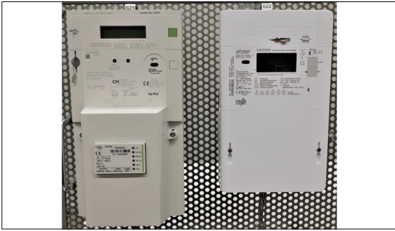
Smart Meter, intelligente Stromzähler.

Ausgangslage: Die Energieerzeugung und der -verbrauch in der Schweiz sind ein grosses Thema, politisch wie auch technisch. Damit die Stabilität des Netzes jederzeit gewährleistet ist, muss das Netz ständig kontrolliert und überwacht werden. Im Niederspannungsnetz könnten dafür die sogenannten Smart Meter eingesetzt werden, welche in allen Haushalten die alten Stromzähler ersetzen. Bis spätestens Ende 2027 sollen diese Smart Meter für fast alle Haushalte Pflicht sein. Diese Smart Meter können untereinander Daten austauschen. Zusätzlich zum Strommessen, können sie Daten, welche von einem Wasserzähler drahtlos übertragen werden, auslesen und verarbeiten. Durch die vielen neuen Systeme gibt es auch sehr viele Ungewissheiten. Eine davon ist die Kommunikation zwischen Wasser- und Stromzählern. Es gibt zurzeit unterschiedliche Kommunikationsschnittstellen, welche aufeinander abgestimmt werden müssen.