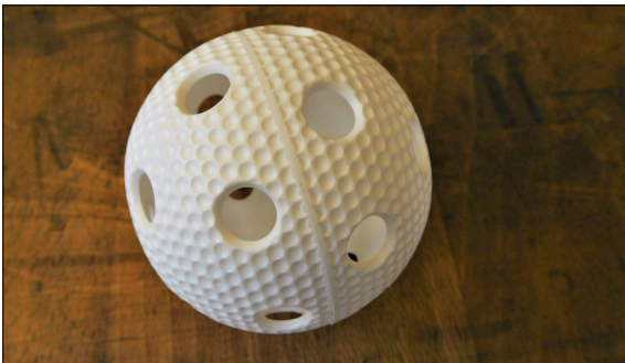
Gefügter Unihockeyball mit einwandfreier Fügenaht

Ausgangslage: Ein beliebter Sport in der Region ist das Unihockey. Auf dem Markt sind viele verschiedene Spielbälle verfügbar, jedoch sind fast alle weiss oder rot. Mit zwei unterschiedlich farbigen Halbschalen könnten aber beispielsweise Bälle in den Vereinsfarben gefertigt werden. Deshalb hat das IWK ein Spritzgusswerkzeug zur Herstellung von farbigen Unihockeyball-Halbschalen entwickelt.