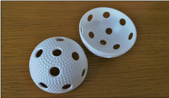
Die Halbschalen hergestellt im Spritzgiessen sind die Halbzeuge für den Schweissprozess