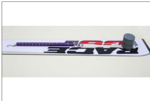
Tribologieversuch zur Bestimmung der Haftreibungskoeffizienten verschiedener Kunststoffproben auf Skiern