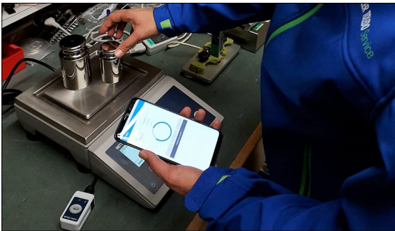
Ein METTLER TOLEDO Service Techniker bei einer Ersteichung

Ausgangslage: Eine wichtige Produkt-Familie der METTLER TOLEDO sind Hochpräzisionswaagen. Für die Einrichtung einer solchen Waage muss eine Ersteichung nach Norm EN45501 durchgeführt werden. Diese Aufgabe wird von METTLER TOLEDO Service-Technikern durchgeführt. Aktuell wird dafür eine Windows-Anwendung genutzt, welche für die Waagen-Kalibrierung, aber nicht für die Ersteichung entwickelt wurde. Entsprechend ist die Nutzung der Anwendung unnötig kompliziert. Zudem ist die Software nicht direkt mit der Waage verbunden. Somit müssen alle Messergebnisse manuell in die Software eingetragen werden, was sehr fehleranfällig und einfach zu manipulieren ist. Diese Fehlerquelle soll minimiert und der Ersteichungsprozess soll mit einem dafür vorgesehenen Programm durchgeführt werden.