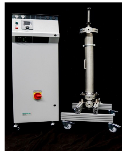
25 kW leistungsstarker Thermoöl-Umwälzthermostat (links) mit dem Reaktor (rechts).