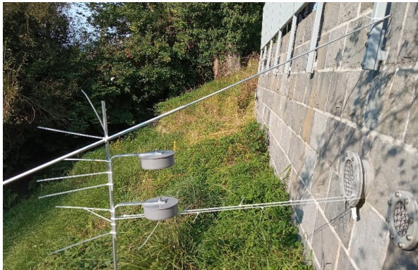
Schwefelwasserstoff-Messung mittels Passivsammler rund um das Kleinwasserkraftwerk in Küsnacht.

dieser Erkenntnisse wurde anstatt der Eisenchlorid-Dosierung eine Nitrat-Dosierung vor der Druckleitung empfohlen. Eisenchlorid kann nur die Ausgasung von bereits gebildetem Schwefelwasserstoff verhindern. Die Messungen des UMTECs haben jedoch aufgezeigt, dass die Gasbildung nach dem Einsatzort der Chemikalie einsetzt und das Fällungsmittel somit wirkungslos bleibt. Das dosierte Nitrat kann im Gegensatz dazu auch nach dem Ort der Zugabe seine Wirkung entfalten. Da der Nitrat-Sauerstoff durch Mikroorganismen leichter angegriffen wird, verhindert es den anaeroben Abbau von im Abwasser vorhandenen stickstoff- oder schwefelhaltigen Substanzen. Dies verhindert auch die Bildung von Schwefelwasserstoff. Mit der Zugabe von Nitrat als Oxidationsmittel anstelle von Eisenchlorid als Fällungsmittel wurde die Schwefelwasserstoffbildung gestoppt. Durch die vom UMTEC getroffene Massnahme wurde die Geruchsemission sowie die Korrosion der Anlage erfolgreich vermindert.